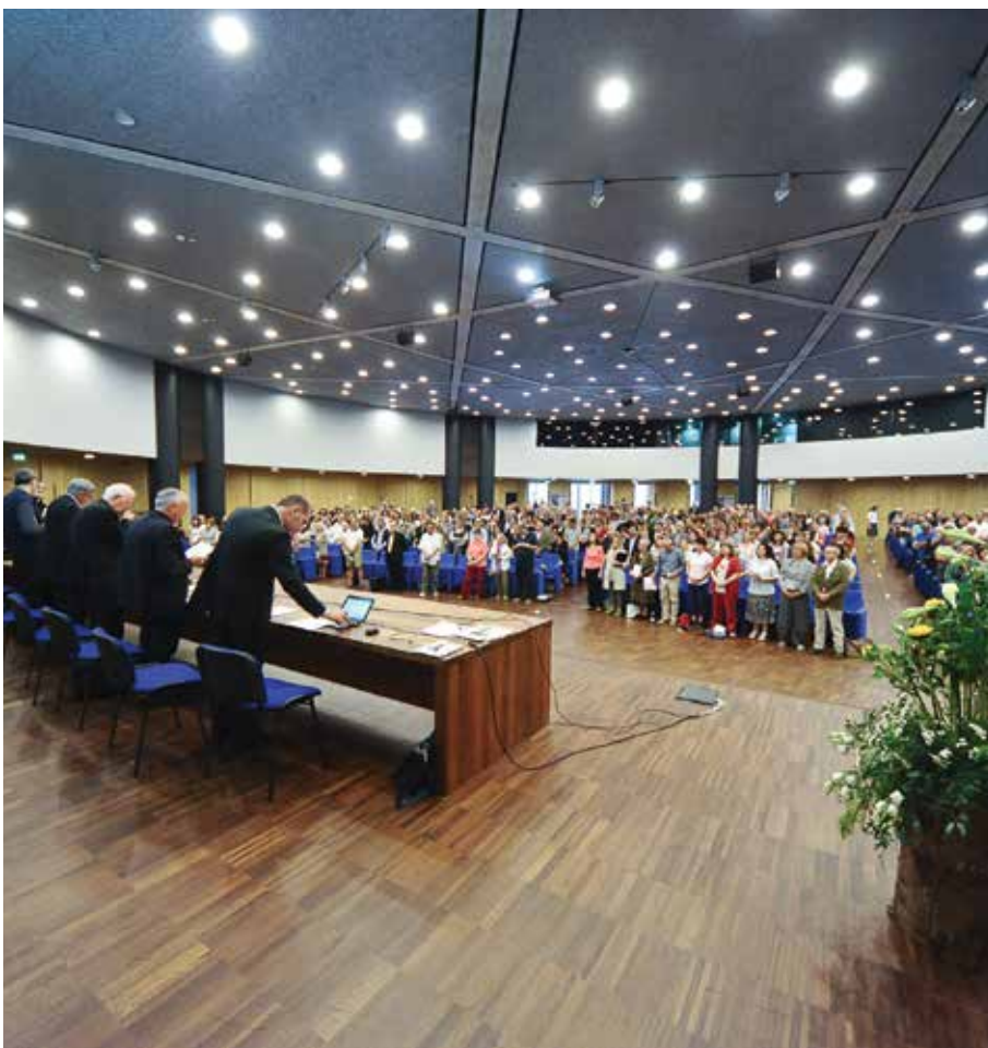
L'annuncio del Vangelo è il centro del nostro impegno nella Chiesa e nel mondo (nella foto: l'Assemblea diocesana del giugno scorso)

1. Una Chiesa in uscita – Si sottolinea la necessità di un profondo cambiamento di prospettiva pastorale che il Papa vuole innescare nelle nostre parrocchie e comunità. Un tempo la gente andava in parrocchia e molti ancora lo fanno perché hanno bisogno di qualcosa che la parrocchia può dare loro sul piano religioso, sacramentale o sociale. Molti ormai non ci vanno più, ma comunque apprezzano che la parrocchia ci sia; e guai a toglierla, perché comunque sta lì e un domani se ne potrebbe avere bisogno. Questa è la prospettiva di una realtà propria di una società statica e ferma, ben radicata nelle sue tradizioni e territorio.