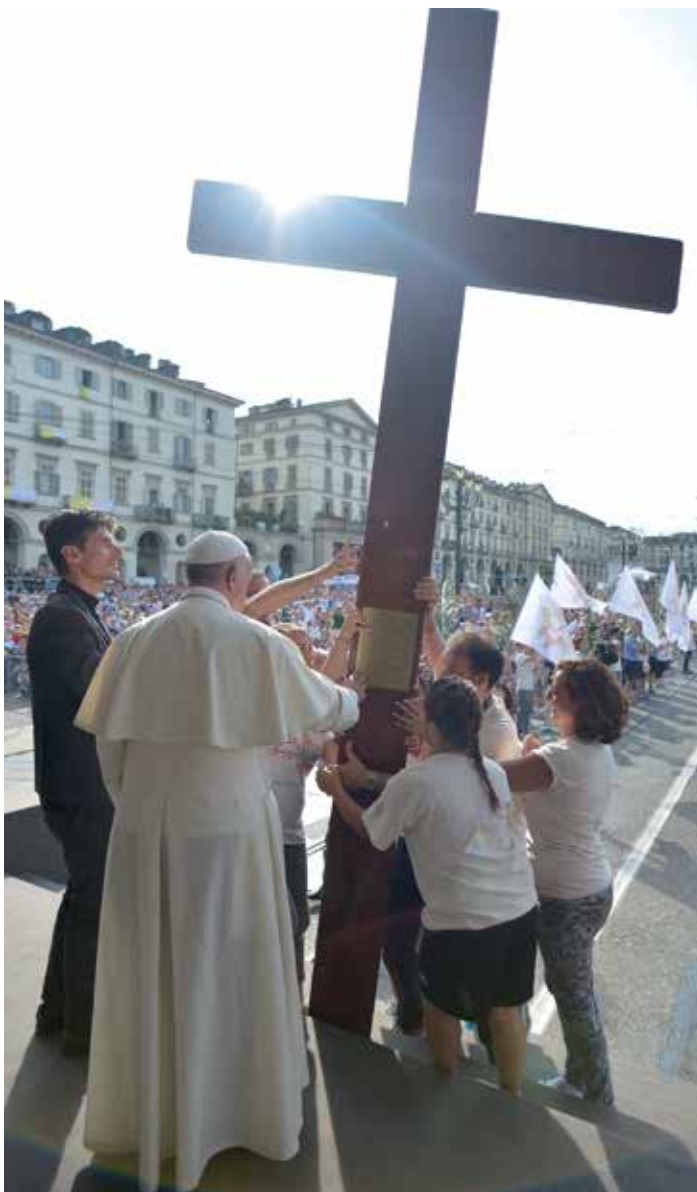
«La croce è il Vangelo dell'amore più grande che Cristo ci ha donato come via di liberazione e promozione dell'uomo da tutte le sue schiavitù morali e sociali» (Papa Francesco in piazza Vittorio a Torino, 21 giugno 2015)

tensione tra la congiuntura del momento e la luce del tempo, dell'orizzonte più grande, dell'utopia che ci apre al futuro come causa finale che attrae.