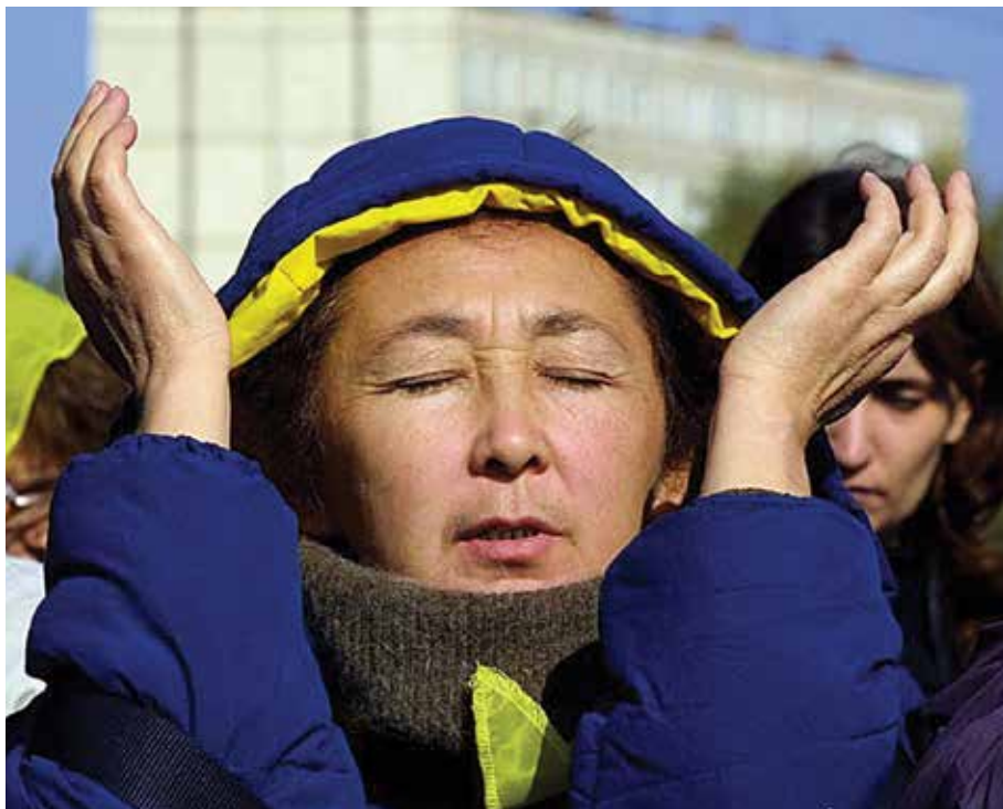
In ogni parte del mondo si fa sentire il richiamo di Dio (visita di Giovanni Paolo II ad Astana, Kazakistan 2001)