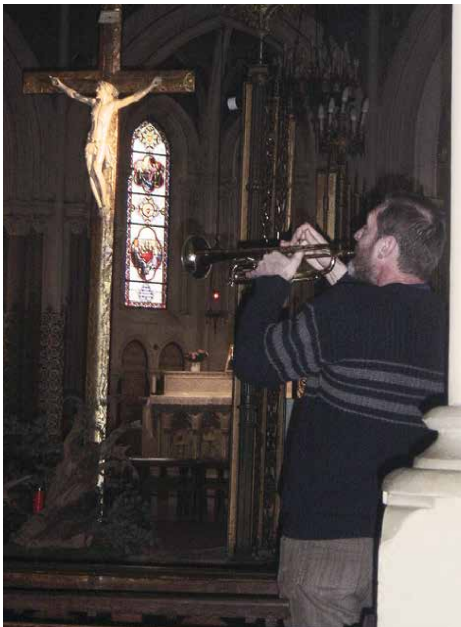
La musica, come ogni altro linguaggio, è una «via» per proporre l'umanità di Gesù Cristo (Lourdes, Basilica superiore)