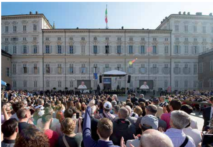
L'Agorà del sociale, che il Papa ci ha incoraggiato a proseguire, è il luogo d'incontro fra l'annuncio del Vangelo e i problemi e le speranze di chi vive nel nostro territorio (nella foto: l'incontro di Papa Francesco con il mondo del lavoro Torino, Piazzetta Reale, 21 giugno 2015)

Chiesa e il grado di istruzione della sua fede, è un soggetto attivo di evangelizzazione e sarebbe inadeguato pensare ad uno schema di evangelizzazione portato avanti da attori qualificati in cui il resto del popolo fedele fosse solamente recettivo delle loro azioni. La nuova evangelizzazione deve implicare un nuovo protagonismo di ciascuno dei battezzati. Ogni cristiano è missionario nella misura in cui si è incontrato con l'amore di Dio in Cristo Gesù; non diciamo più che siamo "discepoli" e "missionari", ma che siamo sempre "discepoli-missionari". Se non siamo convinti, guardiamo ai primi discepoli, che immediatamente dopo aver conosciuto lo sguardo di Gesù, andavano a proclamarlo pieni di gioia: «Abbiamo incontrato il Messia» (Gv 1,41). La samaritana, non appena terminato il suo dialogo con Gesù, divenne missionaria, e molti samaritani credettero in Gesù «per la parola della donna» (Gv 4,39). Anche san Paolo, a partire dal suo incontro con Gesù Cristo, «subito annunciava che Gesù è il figlio di Dio» (At 9,20). E noi che cosa aspettiamo?