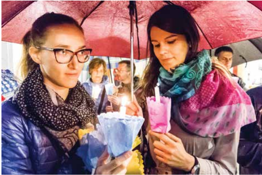
Senza giovani in cammino, non c'è speranza