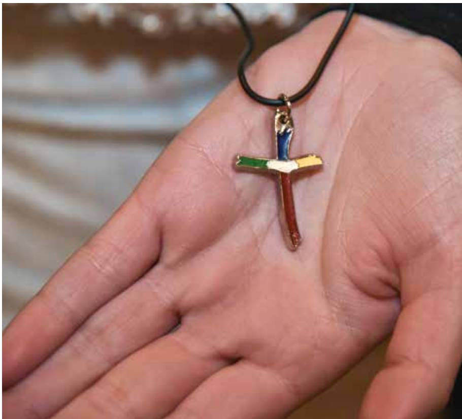
La croce del mandato missionario è il segno più forte che abbiamo